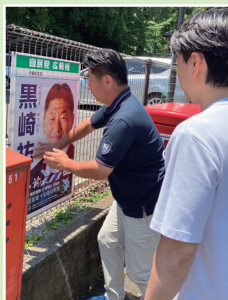
中野新橋駅頭で区民の方にごあいさつ