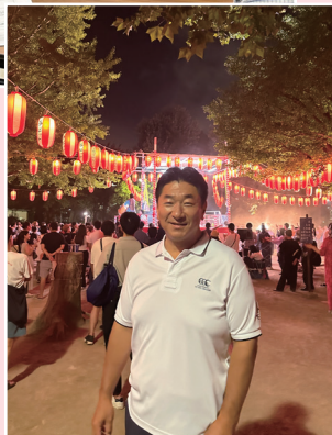
中野区内の盆踊り大会でごあいさつ