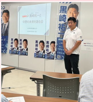
語る会にて活動方針などを説明