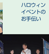
新しい時代を皆さんとともに。