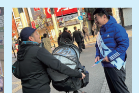
駅頭活動では、以前より多くの 皆さまから 声をかけていただくように