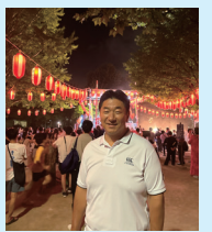
区内各地の盆踊り大 会に参加。4年ぶり に復活したニッポン の夏を体感