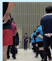
各種スポーツ大会にて ご挨拶