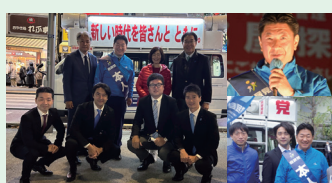
中野区内各地で 街頭演説会を実施