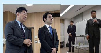
語る会を 対話形式で開催し、 多くの方から意見を いただく