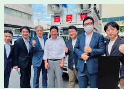
27区選挙区支部主催の 街頭演説会を初開催