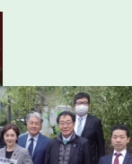
区内各地で おもつき 大会に参加