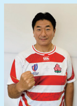
ラグビーW杯 フランス大会が開幕