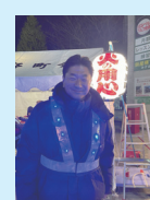
町内会の 歳末夜警に 参加