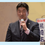
杉並で、自身初の 「語る会」を開催 多くの方に ご参加いただく