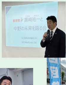
各地で語る会 を実施し、区 民の皆さまに ご挨拶