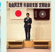
自民党杉並総支部定期総会 にてご挨拶