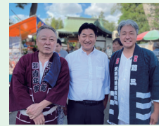
区内各地の夏祭りに参加

4年ぶりに復活した地域 のお祭りやイベントに参加し、 多くの皆さまに ご挨拶させていただきました