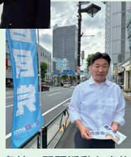
各地で駅頭活動を実施し、 区民の皆さまにご挨拶