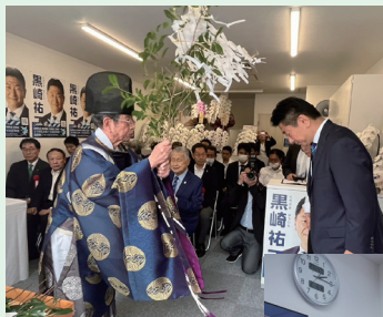
事務所開き・清祓い式を開催 激励の言葉を胸に刻み、 新たなスタートを切る