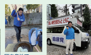
積極的な 広報活動を行う