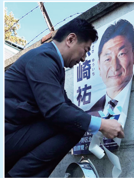
区内各地でポスター貼り