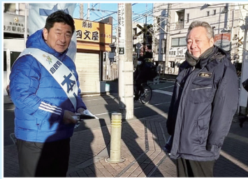
区内各地で駅頭・街頭活動