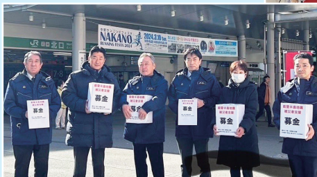
自民党中野区議団と能登半島地震の被災者支援募金活動を実施