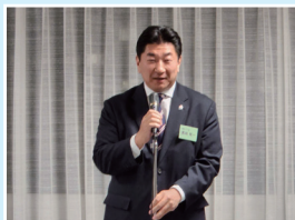
自民党本部で開催される「背骨勉強会」後の会合にて挨拶