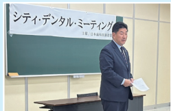
各種会合にて挨拶

中野区内では、週3回(火・水・木)、駅頭に立って、ご挨拶をしています。地域を回るとともに、区民の皆さまのご理解を頂き、ポスターを区内各地に貼らせて頂いています。 さまざまな活動を通じて、日々多くの区民の皆さまから激励やご要望を頂いておりますが、 昨今、自民党に対する、厳しいお声を頂く機会もあります。お一人お一人の声を真摯に受け止め、区民目線・地域目線で政策立案・各種活動を推進してまいります。 若い世代・現役世代にも広く活動を知って頂くため、SNSでの発信を強化しています。インスタライブの実施に加えて、地域のイベント情報や私自身について知って頂けるコンテンツを発信しており、今後も新たな取り組みを実施していきます。 今後も、皆さまのご意見を受け止め、活動を推進してまいります。