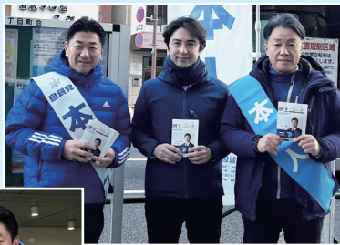
区内各地で駅頭活動