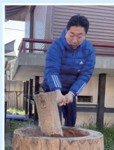
区内の餅つき大会に参加