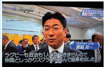
「明治大学ラグビー部創部100周年」記念番組に登場