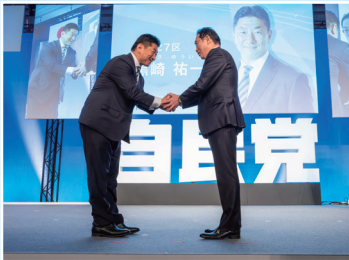
自民党大会に出席

杉並区内では、毎週金曜日、駅頭に立ってごあいさつをしています。地域を回るとともに、皆さまのご理解を頂き、ポスターを区内各地に貼らせて頂いています。さまざまな活動を通じて、日々区民の皆さまから激励やご要望、自民党に対する厳しいお声を頂く機会もあります。先日は、自民党大会に出席しました。民間の感覚や経験をもって、自民党を中から変えていく覚悟と決意を新たにしました。若い世代・現役世代にも広く活動を知って頂くため、SNSでの発信を強化しています。インスタライブ、地域のイベント情報、政策への考え方など、幅広いコンテンツを発信しており、今後も皆さまのご意見を真摯に受け止め、各種活動を推進してまいります。