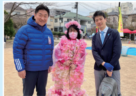
地域イベントに参加